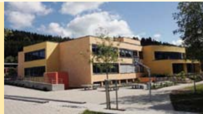
Bildungszentrum Gosheim-Wehingen – Gymnasium und Realschule

wird weiterhin festgehalten. Nachdem bereits in den letzten vier Jahren in die Sanierung und Erweiterung der Schulgebäude