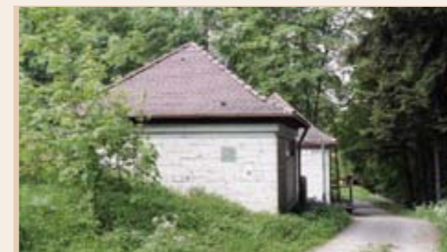
Altes Bedienungsgebäude am Hochbehälter „Hirschbühl“

die bestehende Behälteranlage für den Verbrauch recht knapp bemessen und wird mehr als einmal täglich umgesetzt und ins 270 Kilometer lange Wasser-Netz eingespeist. Auf Grund dessen hat sich der Zweckverband entschlossen, eine weitere Behälterkammer, dessen lichte Innenmaße ca. 44,00 x 25,00 Meter (!)